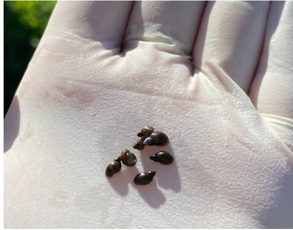
Figure 2. Galba truncatula , principal hôte intermédiaire de Fasciola hepatica

Les œufs sont évacués avec la bile vers le duodénum et sont éliminés avec les fèces (Williams et al. 2014 ; Moazeni & Ahmadi 2016 ; Beesley et al. 2017 ; Andrews et al. 2021).